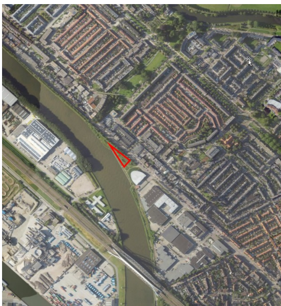
Verworven perceel tussen de Amsterdamsestraatweg en Amsterdam-Rijnkanaal

De gemeente Utrecht heeft december vorig jaar langs het Amsterdam-Rijnkanaal in Zuilen grond gekocht om een park van te maken. Het gaat om zo'n 2.000 m 2 van de voormalige Demka-staalfabriek aan de Amsterdamsestraatweg, ter hoogte van het Van Heukelompark. Het te realiseren Demkapark is qua omvang vergelijkbaar met het groen aan het Prins Bernardplein. De aankoop van deze grond stond al langer op de wensenlijst van bewoners en in het Meerjaren Groenprogramma van de gemeente, maar bleek vanwege de afwikkeling van een faillissement niet eerder mogelijk. We hebben de grond voor 1 euro gekocht en saneren de bodem. Sanering kost naar schatting ongeveer €30.000 en is gedekt in het Meerjaren Groenprogramma. Nu de aankoop rond is, gaan we met bewoners in gesprek om de plannen voor het park vorm te geven.