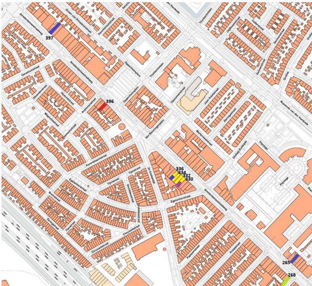
Kaart 3.3: Sluitingen vanaf juli 2014 op de Amsterdamsestraatweg, vanaf het middenstuk 36 (het gedeelte met collectieve sluitingstijden) tot aan de Marnixlaan.

Legenda (reden van sluiting): geel = illegaal gokken; rood = illegale prostitutie; groen = drugs; paars = faciliteren criminele activiteiten; blauw = overig.