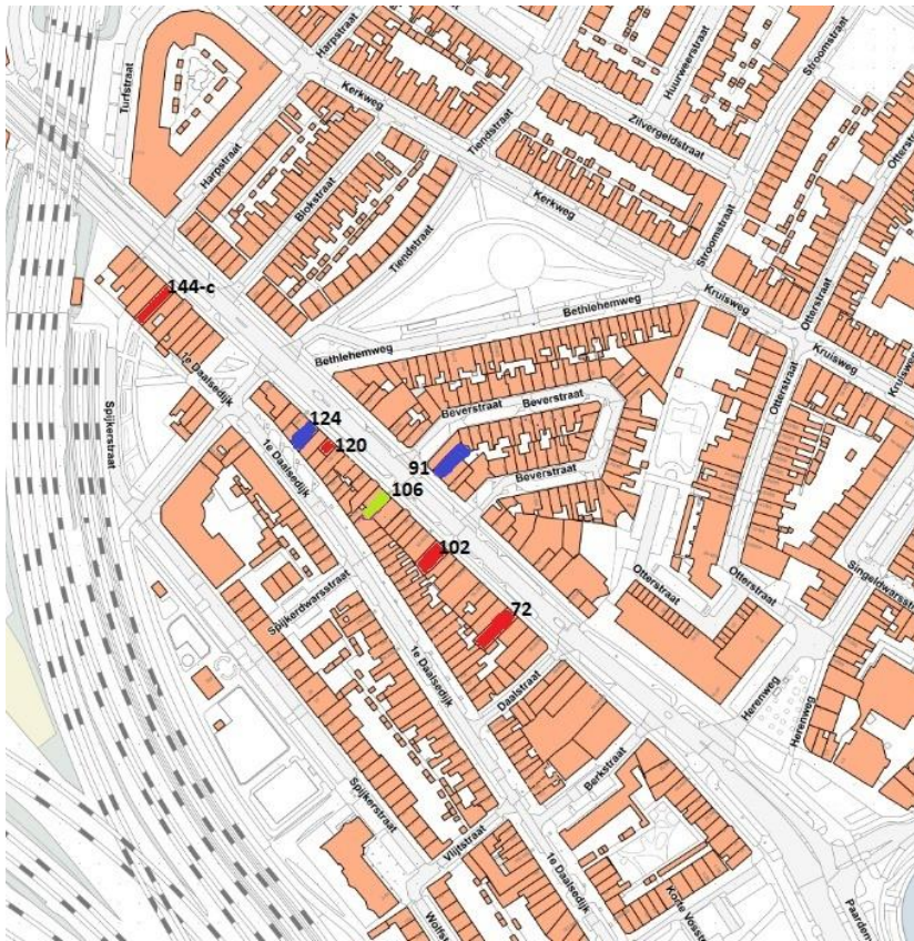
Kaart 3.1: Sluitingen vanaf juli 2014 op de Amsterdamsestraatweg, op het gedeelte van de Daalsesingel tot aan het spoorwegviaduct.

Legenda (reden van sluiting): rood = illegale prostitutie; groen = drugs; blauw = overig. Nummer 124 is twee keer gesloten (categorie overig).