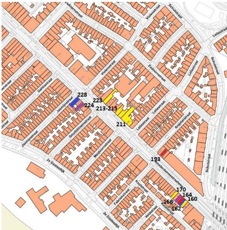
Kaart 3.2: Sluitingen vanaf juli 2014 op de Amsterdamsestraatweg, op het middenstuk (het gedeelte met collectieve sluitingstijden).

Legenda (reden van sluiting): geel = illegaal gokken; rood = illegale prostitutie; paars = faciliteren criminele activiteiten; blauw = overig.