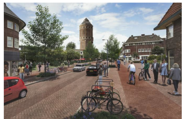
Sfeerbeeld van de straat na het opnieuw inrichten.

Lees verder op de achterkant voor meer informatie